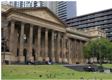
ビクトリア州立図書館の外観