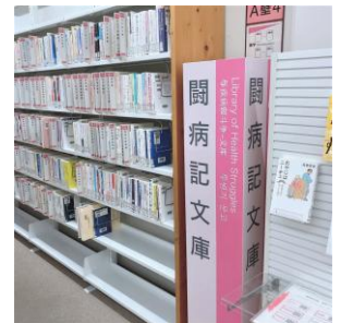
②1階 読病記文庫コーナー