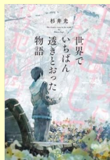
世界でいちばん透きとおった物語 (杉井光著 / 新潮社)

知人の紹介で手にとった『世界でいちばん透きとおった物語』。「紙の本でしか体験できない感動がある」という帯の言葉は本当に本当でした。読んだ後にそのすごさが響きます。爽快感に包まれる1冊。何を读もうか悩んでいる皆さんに強くお勧めしたい本です。