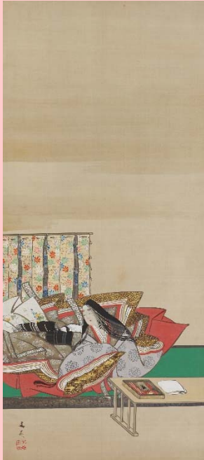
伝谷文晁筆《紫式部図》 江戸時代・19世紀 東京国立博物館

積極的でカラリと明るい清少納言に比べ、紫式部は消極的で生真面目な印象がありますが、現在、NHK大河ドラマ「光る君へ」で俳優・吉高由里子さんが演じていらっしゃる紫式部は、とてもチャーミングで可愛らしく、親しみを感じますね。ドラマ内で描かれている藤原道長との関係性に毎週もどかしさを感じつつ胸ときめかせていますが、歴史上、紫式部は藤原道長の娘・中宮彰子に仕えた女房として知られ、紫式部と道長との関係性には様々な説が唱えられています。本ドラマではお互いが惹かれ合い、ソウルメイトのような特別な絆が描かれているように感じますが、恋愛ドラマの第一人者として知られる脚本家・大石静さんならではのオリジナルストーリーには魅了されるばかりで、今後の展開が楽しみです。