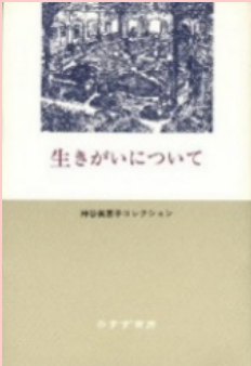
神谷美恵子コレクション 生きがいについて (神谷美恵子著 / みすず書房)

神谷美恵子氏の生きがいの結晶ともいえる著書『生きがいについて』。「こんな本に出会いたかった」と感じさせてくれる、深く胸に響く本です。本書から彼女の温かく誠実な人柄が伝わってきます。