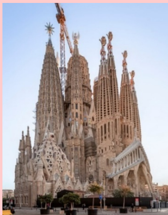
写真: サグラダ・ファミリア聖堂、2023年1月撮影 ©Fundació Junta Constructora del Temple Expiatori de la Sagrada Família (画像の転載ならびにコピー禁止) 会場: 東京国立近代美術館 1F 企画展ギャラリー (〒102-8322 東京都千代田区北の丸公園3-1) 会期: 2023年6月13日(火)~9月10日(日) ※会期中一部展示替えあり 開館時間: 10:00~17:00(金曜・土曜は10:00~20:00)(入館は開館の30分前まで) 休館日: 月曜日(ただし7月17日は開館)、7月18日(火) 観覧料: 一般 2,200円 / 大学生 1,200円 / 高校生 700円 ※中学生以下、障がい者手帳をお持ちの方とその付添者(1名)は無料。それぞれ入館の際、学生証等の年齢のわかるもの、障がい者手帳等をご提示ください アクセス: 東京メトロ東西線「竹橋駅」1b出口より徒歩3分 ほか 展覧会公式HP: https://gaudi2023-24.jp/ 東京国立近代美術館HP: https://www.momart.go.jp/ ※最新の情報はHPをご覧ください ※遊覧、愛知へ巡回予定