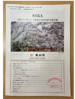
彩 患者と家族の交流誌 (全国パーキンソン病友の会 埼玉県支部)

ある患者様の手記では、医療従事者の方から投げられた心無い言葉に傷つき、胸を痛めたお話が綴られていました。医療職を目指す学生の皆さんにはぜひ読んで欲しい。皆さんはこの手記をどのように感じられるでしょうか。教科書や参考書では得難い、患者様やそのご家族のリアルなお声を聞くことができます。本誌を通じて、パーキンソン病への理解をより一層深めてはいかがでしょうか。