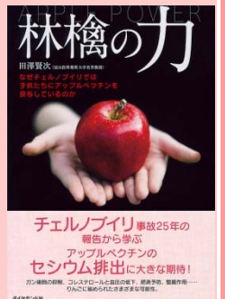
林檎の力 (田澤賢次 著/ダイヤモンド社 刊)

真っ赤なみずみずしいりんごが店頭に並びこの季節。「1日1個のりんごは医者を選ばせる」という諺があるほど、りんごは栄養成分が豊富で健康効果が高いとされています。その効能は多岐に渡り、高血圧予防や血中コレステロールの降下、便秘解消などのほか、食べ合わせる食材によってはさらに効果的な効能を期待することができます。さて、日本にりんごが伝わったのはいつ頃だと思えますか？ 諸説ありますが、まず平安時代から鎌倉時代にかけて中国から「和りんご」が伝わり、その後、明治時代初期にアメリカやヨーロッパから「西洋りんご」が伝来したと言われています。私たちが現在食べているのは「西洋りんご」で、この西洋りんごの伝来をきっかけに日本国内で本格的なりんご栽培が始まったそうです。現在でも品種改良を重ね、品質の高いりんごが次々と生み出されていますが、日本のりんごのように甘さと酸っぱさのバランスがよいものは珍しく、その品質は世界一とも呼び声が高いです。ちなみにりんごの最適な保存方法は、ビニール袋に入れて密封し、冷蔵庫の野菜室へ入れることだそうです。鮮度の高いりんごを食して、風邪知らずの冬を過ごしましょう。