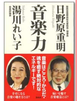
音楽力 (日野原重明・湯川れい子 著/海竜社 刊)

音楽は時に私たちを癒し、生きる活力を与えてくれます。ラグビーワールドカップで日本代表チームの主将を務めたリーチ・マイケル選手は、演歌歌手の細川たかしさんの大ファンだそうで、日本語を勉強するときもトレーニングを行う際も細川さんの曲に支えられていたそうです。音楽の力は医療現場でも「音楽療法」としてその効果が期待されています。対象は乳幼児から高齢者まで幅広く、健全な方から重度の障害をもつ方まで様々な場面で用いることが可能です。医者や薬の力では回復が見込めなかった精神疾患患者が、音楽療法によって目を見張るほどの回復をみせた事例も挙げられています。音楽にはストレスを解消したり、精神的な緊張を解きほぐす効果があるそうです。疲れやストレスを感じたら、音楽を聴く時間をもってみませんか？ 人生の中で音楽を聴く時間をもつ人ともたない人とは、その充実度は大きく異なるといわれています。いまはパソコンやスマートフォンですぐに音楽が聴ける時代ですから、ちょっとだけ音楽を楽しむ時間をもってみましょう。音楽のある日常は皆さんの生活をより潤いあるものにしてくれるに違いありません。