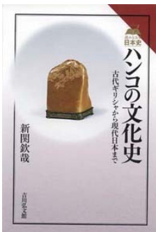
ハンコの文化史 (新聞欽哉 著/吉川弘文館 刊)

印鑑の歴史はとても古く、その始まりは古代メソポタミアからと言われています。日本で有名な印というと「漢委奴国王」の金印を思い浮かべる方も多いと思いますが、この金印は漢の光武帝から倭奴国王に授けられたもので、天明4年に志賀島(現在の福岡県福岡市東区)から出土されました。実用的に使用された可能性は少なく、宝物として大切に保管されていたと考えられています。日本で実際に印鑑が使われるようになったのは奈良時代からといわれています。新しい律令制度が制定されてから官印として使用されていたそうですが、平安時代に入ると律令制の衰退とともに官印の使用は減少し、「花押(かおう)」という符号が用いられるようになりました。戦国時代には独自性に飛んだ私印が多く使用され、北条氏の「虎の印判」や織田信長の「天下布武」などが有名です。江戸時代になると行政整備や商業の発達に伴い印鑑が庶民へと普及し、明治時代には印鑑制度が確立され、官印も復活したそうです。なお、図書館の本には1冊ごとに蔵書印が押しありますが、始まりは北条実時が創設した「金沢文庫」で、収蔵する書籍に「金沢文庫印」を押ししたことが蔵書印の始まりといわれています。