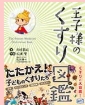
『王子様のくすり図鑑』 木村美紀/著、じほう/刊