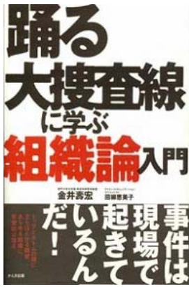
『踊る大捜査線に学ぶ組織論入門』 金井壽宏、田柳恵美子/著、かんき出版/刊