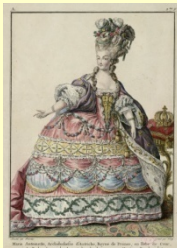
(上・左) エリザベト・ルイーズ・ヴィジェ・ル・ブラン《ゴール・ドレスを着たマリー・アントワネット》1783年頃ワシントン・ナショナル・ギャラリー・ティムケン・コレクション / (上・右) ルイ・オーギュスト・ブラン、通称ブラン・ド・ヴェルソワ《狩猟をするマリー・アントワネット》1783年頃ヴェルサイユ宮殿美術館 / (下) マルシャル・ドニ・クロード・ニルイ・デレの着画に基づく《大盛装のオーストリア皇女、スラス7王妃マリー・アントワネット》1785年以降ヴェルサイユ宮殿美術館

悲劇のヒロインー マリー・アントワネット。漫画『ベルサイユのばら』や宝塚歌劇でご存じの方も多いでしょう。14歳でフランスに嫁ぎ、37歳で激動の生涯を終えた彼女ですが、一方で、ファッションリーダーであり、時代の先端を走っていた女性でもあります。21世紀となった現在も多くの人々を魅了してやみません。今回の「マリー・アントワネット展」では、ヴェルサイユ宮殿企画・監修のもと、肖像画や王妃の愛用の品々、革命期の貴重な資料など、およそ200点が展示されます。見どころのひとつとして、プライベート空間の原寸大再現は宮殿監修ならではの、また、フェルセン伯爵との恋について、新たな証拠も紹介されています。