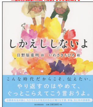
『しかえししないよ』 日野重明・詩 いわさきちひろ・絵 朝日新聞出版：刊 日野原先生といわさきちひろさんの温かい言葉が心に響かれます。