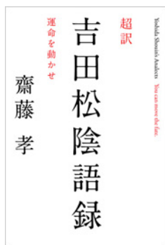
『超訳 吉田松陰語録』 齋藤 孝：著 / キノックス：刊 魂に火がつく! 先人の言葉に学ぼう!