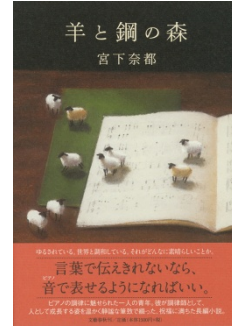
『羊と鋼の森』 宮下奈都：著 / 文藝春秋：刊 2016年本屋大賞第1位の作品です。