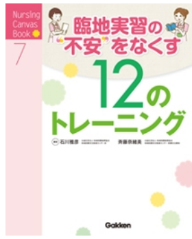
『臨地実習の不安をなくす12のトレーニング』 石川雅彦・斉藤奈緒美：著 学研行 勁草書房：刊 実習に不安を抱いている方、必読です!