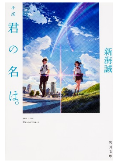
『小説君の名は。』 新海 誠：著 / KADOKAWA：刊 今夏公開映画の監督自ら執筆した原作小説です。