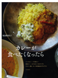
『カレーが食べなくなったら』 坂田阿希子：著 / 文化出版局：刊 今夜のメニューはカレーで決まり!

学生選書ツアーで選ばれた本をご紹介します! 図書カウンター前「学生選書コーナー」より厳選8冊!