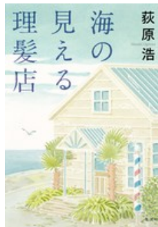
『海に見える理髪店』 荻原 浩：著 / 集英社：刊 魔打つ家談小説の短編集です。第155回直木賞。