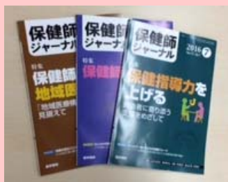
「保健師」の名の付く唯一の専門誌 『保健師ジャーナル』(医学書院)