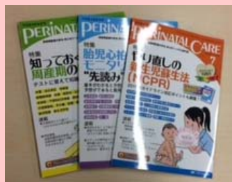
周産期医療の安全安心をリードする 『ペリネイタルケア』(メチカル出版)

毎日の学習や実習、国試対策などで最新の情報を手に入れたい場合は、専門雑誌がおおすすめです。当館には50誌以上のタイトルを取り揃えています。上記はほんの一例です。この夏休み、ゆっくり図書館で眺めてみてはいかがでしょうか? ちょっとしたコラムやお悩み相談室などを読むのも楽しいですよ。ぜひ、お手にとってご覧ください。