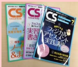
看護学生の「ナースになりたい」を応援する 『クリニカルスタディ』(メチカルフレンド社)