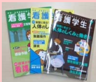
皆さんの目標達成をサポート 『看護学生』(メチカルフレンド社)