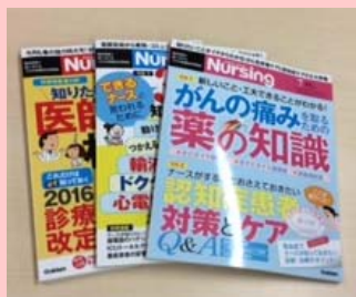
臨床実践に強くなる看護総合情報誌 『月刊ナーシング』(学研)