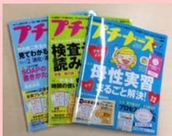
看護学生の実習・国試をサポート! 『アチアチアチナース』(照林社)