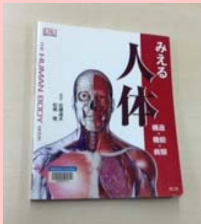
みえる人体 構造・機能・病態 Steve Parker/著 南堂