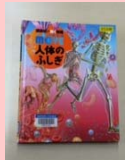
人体のふしぎ 著者の動く図鑑 WONDER MOVE 島田進生/監修 南堂