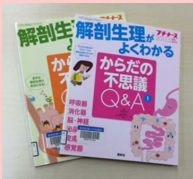
解剖生理学がよくわかるからだの不思議Q&A ①・②/オナナス 山岡司/編著 南堂