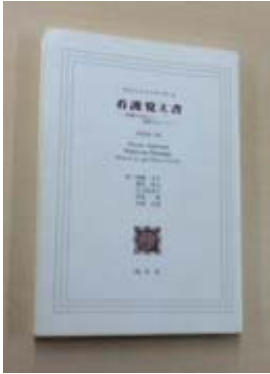
『看護覚え書』 F.ナイチンゲール 著/現代社

現在、1年生の看護入門演習に参加し、「看護覚え書」の読解を行なっています。ナイチンゲールは1851年、ドイツのデュッセルドルフにある病院付学園施設カイザースヴェルト学園で看護を学んでいました。この本は、私の人生の節目で読むことが多く、読む度に色々な示唆を与えてくれる書籍でした。私は、博士課程で学んでいる時に、日本はドイツの医療保険制度と介護保険制度を参考にしていることから、ドイツに行って現在の看護を見てこようと考え、ナイチンゲールの学んだカイザースヴェルトや介護と看護の博物館、ピュルツブルグ大学物理学教室のX線発見の部屋、訪問看護師と介護士が働いているディアコニーデ（訪問看護と介護がステーションを一緒に運営しています）など視察してきました。友人と二人で12月のドイツのクリスマスマーケットの時期に1週間行きました。