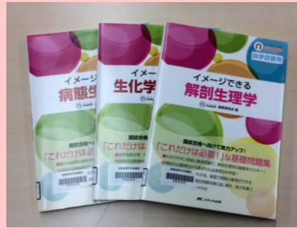
(左から) イメージできる解剖生理学 イメージできる生化学・栄養学 イメージできる解剖生理学 ナソウ・サノ 編集委員会/編 メディカ出版