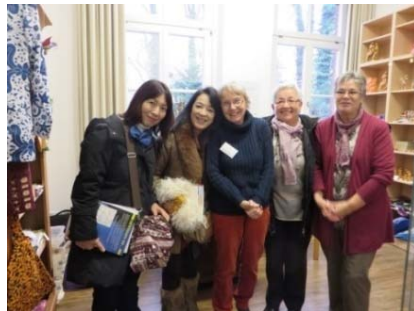
～介護と看護の博物館の元ナースの方々と～