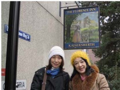
～カイザースヴェルトの出入口にて～

ディアコニーデでは、午前中に創傷処置専門ナースに同行し、5件ほど下肢に潰瘍などのある在宅療養者の方々のご自宅を訪問しました。クリスマスの時期だったので、どこもツリーが飾ってあり、明るく華やかなムードでした。高齢者の一人暮らしの方も多く、鍵を持って覚醒を促しながら、短時間で創傷処置のみを行いながら会話をしました。一人暮らしの高齢の男性で、昔テレビ局で映像の仕事をしていた方は、たくさん写真が部屋に飾ってあり、それを見せながらどこに行ったかを教えて下さいました。充実した看護の原点に戻る旅でした。