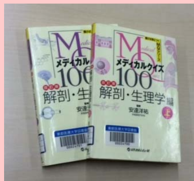
メディカル100 解剖・生理学編 上・下 安斎雅也/編著 メディカルビュー社