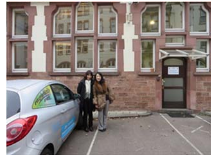
～ディアコニーデの出入口にて～