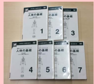
基礎からのバゲージョンシリーズ: 人体の基礎 全7巻 医師/制作・著者 南堂

1年生の皆さん。入学して2ヶ月ちょっと過ぎましたが、大学生活はいかがでしょうか。学ぶことがたくさんで、授業も難しくして…という学生さんも多いのではないのでしょうか。図書館では、さまざまな分野においてわかりやすい参考書や問題集を取り揃えています。上記は「解剖生理学」の一例です。図がたくさん載っているもの、わかりやすい解説+（プラス）穴埋め式の問題が掲載されているものなど、色々な種類があります。図書のほかにDVDで勉強する、という方法もありますよ。自分に合った参考書を見つけて、いまから基礎を固めてみませんか？