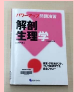
パワーアップ問題演習 解剖生理学 竹内修二/著 医学書院