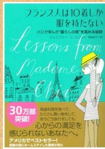
『フランス人は10着しか服を持たない』 スコット, ジェニファー・L/著・大和書房刊