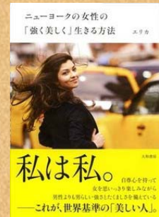
『ニューヨークの女性の「強く美しく」生きる方法』 エリカ/著・大和書房刊