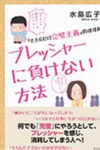
『プレッシャーに負けない方法』 水島広子/著・さくら舎刊