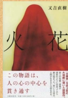
『火花』 又吉直樹/著・文藝春秋/刊